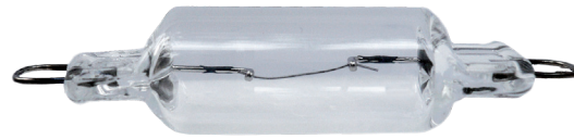
Xenon - Rigid Loop